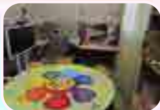
Кабинет учителя - логопеда