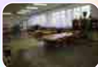
Фойе 2-го этажа