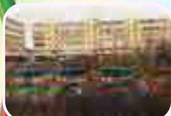
8 прогулочных площадок