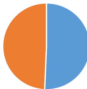
Гендерный состав воспитанников на 2024-2025 уч. год

■ 1-3 лет ■ 3-4 года ■ 4-5 лет ■ 5-6 лет ■ 6-8 лет