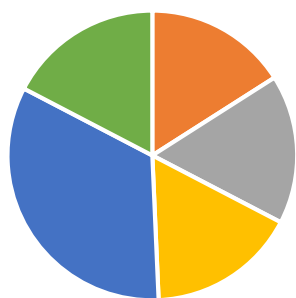
Возрастной состав воспитанников на 2024-2025 уч. год

■ 1-3 лет ■ 3-4 года ■ 4-5 лет ■ 5-6 лет ■ 6-8 лет