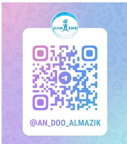
Телеграмм канал АН ДОО «Алмазик»