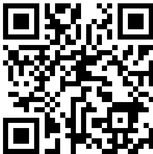
Сайт АН ДОО «Алмазик»