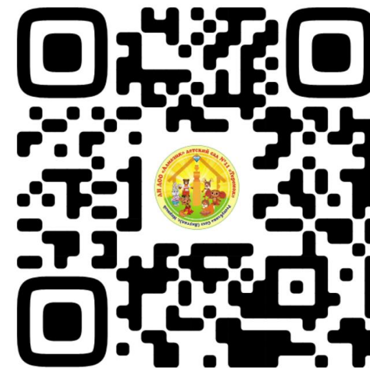
Вконтакте Детский сад № 11 «Теремок»